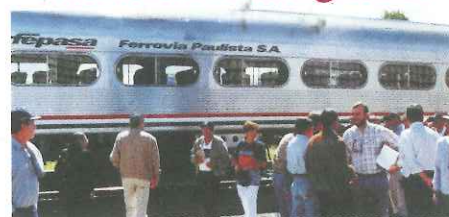
Associados do noroeste paulista e Mato Grosso do Sul cruzaram a ponte rodoferroviária sobre o Rio Paraná

A inauguração, em 31 de maio, dos primeiros 310 km da Ferronorte começa a tornar realidade o projeto ferroviário de 5 mil km que ligará o centro-oeste à região sudeste do Brasil. A PREVI possui cerca de 25% do capital total do empreendimento. Antes da inauguração, mais de 200 associados da PREVI daquela região foram conhecer de perto a Ferronorte.