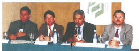
A presença de todos os dirigentes da PREVI favoreceu o debate de temas importantes.

diretoria na administração. Foram discutidas questões sobre Reforma da Previdência, modelo de gestão da PREVI, investimentos, empréstimo simples, financiamento imobiliário, entre outras. O objetivo do Encontro foi levar o máximo de informações aos representantes das entidades para que eles atuem como multiplicadores junto aos associados. Está prevista a realização de outro Encontro ainda este ano.