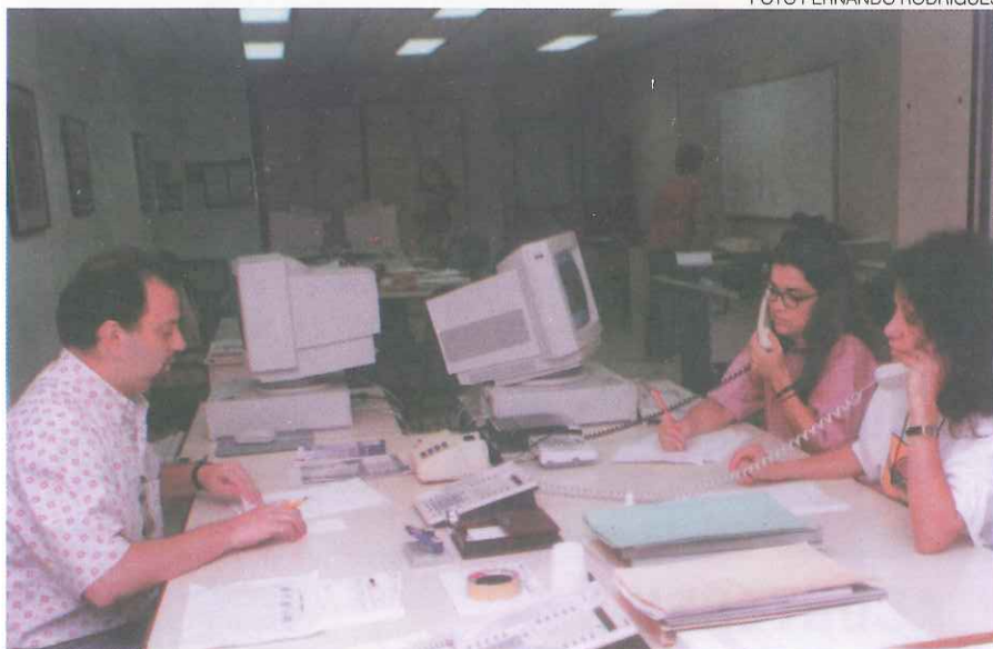
A Gerência de Atendimento esteve em linha direta com o associado.

O Boletim PREVI é editado pela PLANE – Gerência de Planejamento e Comunicação da Caixa de Previdência dos Funcionários do Banco do Brasil. Endereço: Praia do Flamengo, 78. CEP 22210-030. Telefone: (021) 553-0050. Tiragem desta edição: 140 mil exemplares. Distribuição gratuita a todos os associados e pensionistas.