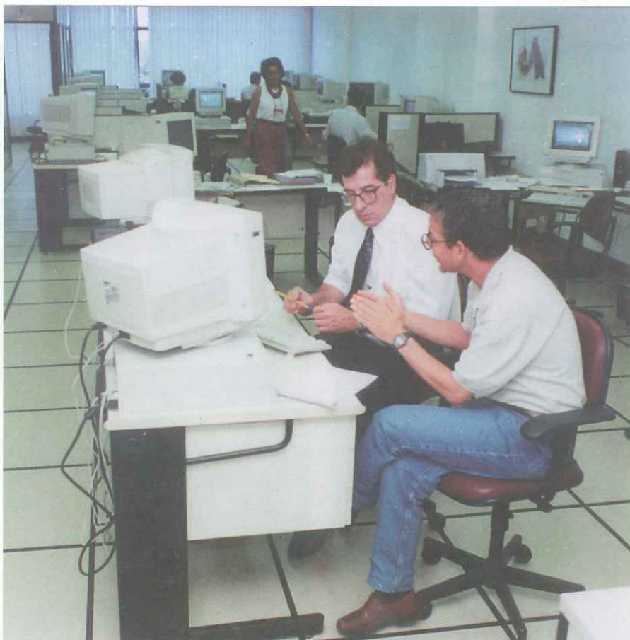
A atualização do parque de informática teve prosseguimento.

Na mesma data, foram empossados os representantes eleitos pela Chapa 4 PREVI - Cons-