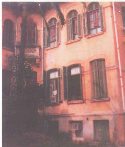
Umberto Primo: investimento em novo setor.

A compra do terreno que inclui o hospital Umberto Primo por R$ 42 milhões possibilitará a concretização de um empreendimento de R$ 200 milhões que terá,