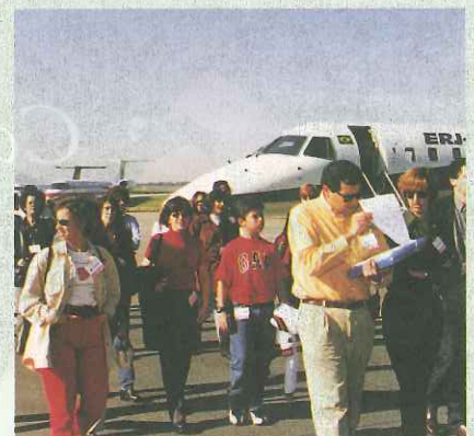
Associados visitam a Embraer, empresa responsável pela geração de sete mil empregos diretos e três mil indiretos.