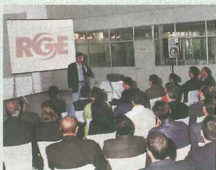
Associados assistem à palestra sobre a RGE.

O Programa de Visitas a empresas levou, no mês de junho, sessenta associados da região de Caxias do Sul - RS, para conhecer a Central de Atendimento Telefônico ( Call Center ) da Rio Grande Energia, localizada naquela cidade. A RGE é uma das três concessionárias de energia do Rio Grande do Sul, sendo responsável pelo fornecimento de energia elétrica para o norte do Estado. A PREVI possui 25% do capital total da empresa e conta com três representantes no conselho de administração.